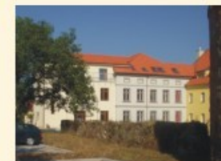
Hospic sv. Jana N. Neumanna Prachatice