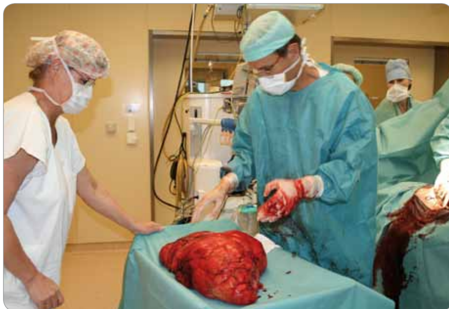
Obr. 2. Fotografie tumoru na operačním sále.

Stručný popis případu: Muž, narozen 1964, operovaný v červenci 2012 v Masarykově onkologickém ústavu pro objemný tumor retroperitonea. Z anamne-