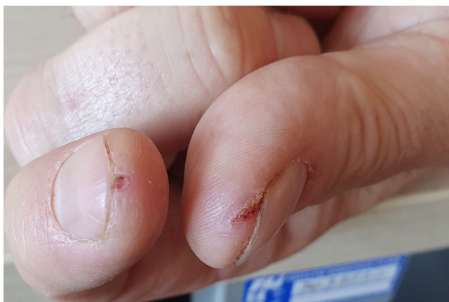
Praskliny kůže na prstech.