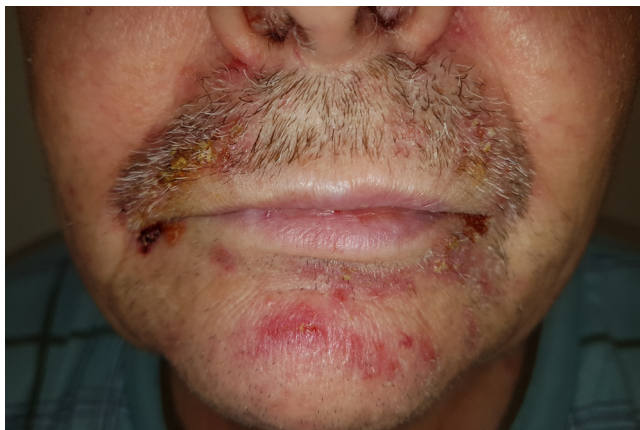
Typický výsev podobný akně (akneiformní ekzantém) okolo úst, ragády rtů a jejich koutků.

anti-EGFR monoklonální protilátka = cílené biologické léčivo, protilátka (bílkovina, imunoglobulin) blokující působení růstového faktoru pro epitel kůže a sliznic a tím pak blokující i jeho stimulační efekt pro buňky karcinomu sliznice dutiny ústní nebo tlustého střeva; léčba těmito protilátkami může být doprovázena i některými vedlejšími účinky, které se týkají převážně kůže nebo sliznic. Základní anti-EGFR protilátky jsou cetuximab a panitumumab.