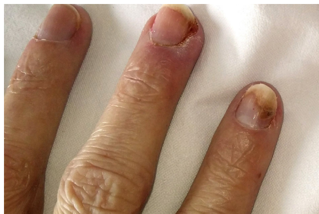
Záněty nehtového lůžka (paronychia).