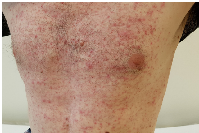
Typický výsev podobný akně (akneiformní ekzantém) na hrudi.